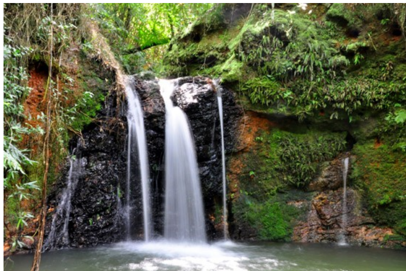
Vista del Salto Kañinmy/Vista do Salto Kañinmy

“É uma unidade de proteção ambiental criada e mantida pela Itaipu na margem Paraguaia, está aberta a visitação turística.”