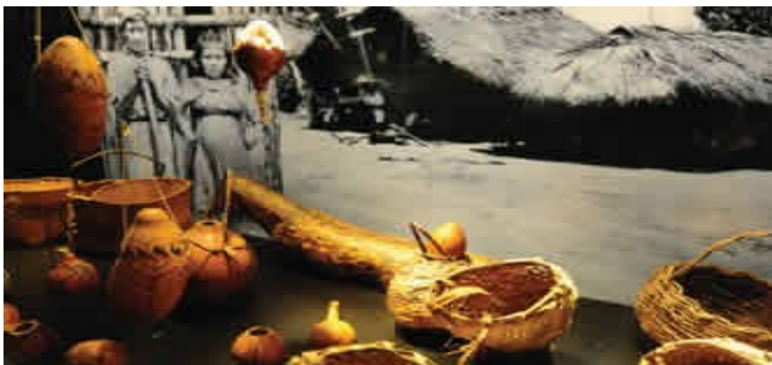
Muestras del Museo de la Tierra Guaraní / Amostras do Museu da Terra Guarani

“O Museu da Terra Guarani resgata os dez mil anos de ocupação e cultura Guarani do lado paraguaio de Itaipu.”