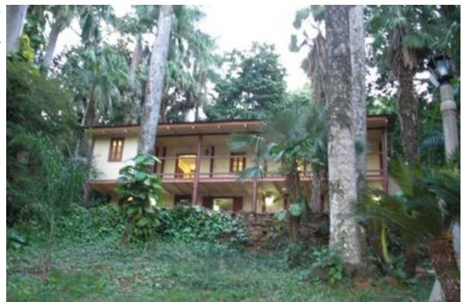
Vista de la casa de Moisés Bertoni / Vista da casa de Moisés Bertoni

Conhecer o legado do mais importante cientista e pesquisador da história do Paraguai, brilhante biólogo, meteorologista, cartógrafo e agrônomo, Moisés Santiago Bertoni que se estabeleceu as margens do rio Paraná no final do século XIX. Viveu em uma casa incorporado na selva paraguaia de onde suas pesquisas e experimentos eram conduzidos, rodeado pela natureza de incrível variedade e exuberância. Hoje transformado em um museu aberto à visita turística, o local abriga dez salas nas quais o visitante encontra objetos pessoais, manuscritos de livros, cartas e parte da biblioteca de 7.000 volumes, jornais, revistas e mapas raros dos séculos XIX e XX, bem como uma reconstituição do laboratório e da gráfica usada por Bertoni para imprimir suas publicações.