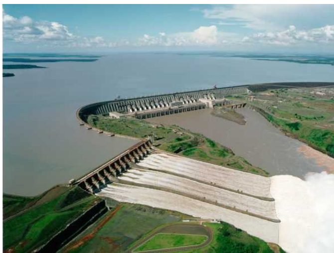
Imagen aérea de la Itaipu Binacional/Vista aérea da Itaipu Binacional

Te invitamos a conocer el interior de la Central Hidroeléctrica. Admirar la visión panorámica desde el mirador central es fascinante y el gigantismo de Itaipú es aún más perceptible cuando se recorre la represa. Las atracciones son la arquitectura, que recuerda la de una catedral por causa del formato cóncavo, y el antiguo lecho del río Paraná. En el Edificio de Producción, el visitante tiene la oportunidad de conocer la sala de comando central, que controla la operación de turbinas y generadores, y la enorme galería de donde se puede ver las tapas de las unidades generadoras.