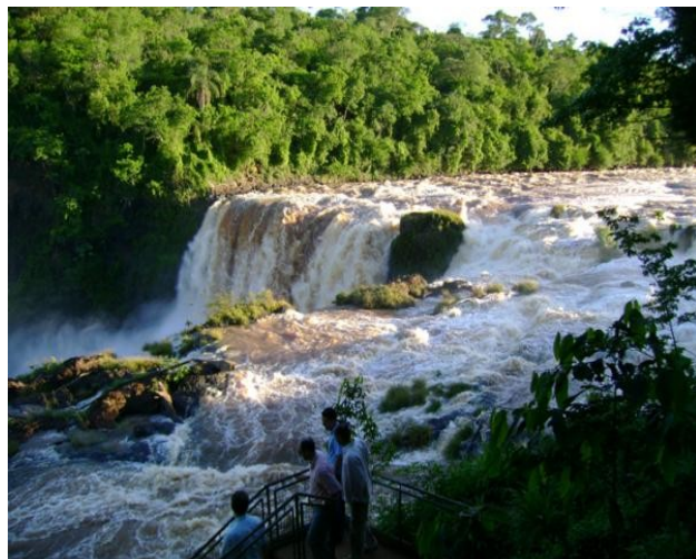
Vista del Salto Monday /

Apreciar el espectáculo natural proporcionado por las caídas de agua más buscadas de Paraguay. Cercados por mata nativa y bien preservada, los saltos del río Monday están cerca de la frontera con Brasil y Argentina, a 10 km de la Ciudad del Este. Sendas en medio de la vegetación llevan a los visitantes hasta miradores y pasarelas de donde es posible contemplar la depresión de 40 metros del río. A quienes les gusta la aventura, los paredones rocosos favorecen la práctica de rapel, trekking y alpinismo al lado del turbión de aguas. La atracción está dentro del Parque Municipal Saltos del Río Monday, que ofrece espacio para camping y comidas.