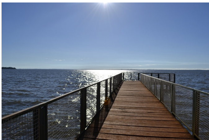
Vista del mirador del lago de Itaipu/Mirante do lago de Itaipu

Pasear por las 2.245 hectáreas de bosques naturales, cascadas como el Salto Kañinmy y nacientes de aguas cristalinas. Caminos interpretativos llevan a los visitantes del Refugio Tatí Yupí en un ecosistema de fauna rica y flora variada. Las sendas se pueden recorrer en bicicleta, charretes o a caballo. Guías acompañan a los turistas, que encuentran infraestructura completa, con área para acampar, alojamiento para grupos, agua potable, luz, sanitarios, canchas de deporte y enfermería.